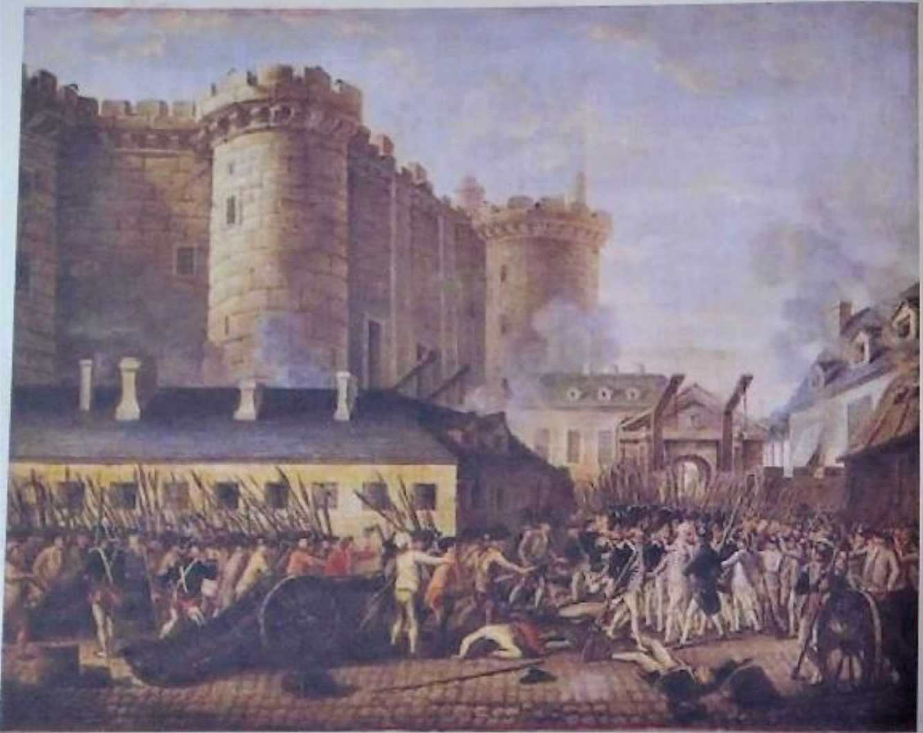
▲ Ζωγραφική απεικόνιση της άλωσης της Βαστίλης από τους Γάλλους επαναστάτες (14 Ιουλίου 1789)

Στα τέλη του 18 ου αιώνα ξέσπασαν δύο μεγάλες επαναστάσεις: η Αμερικανική Επανάσταση , το 1776 και η Γαλλική Επανάσταση , το 1789. Οι επαναστάσεις αυτές επηρεάστηκαν από τις ιδέες του Διαφωτισμού.