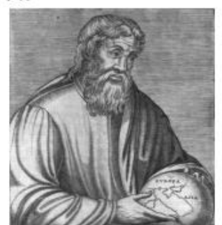
ΕΚΑΤΑΙΟΣ Ο ΜΙΛΗΣΙΟΣ