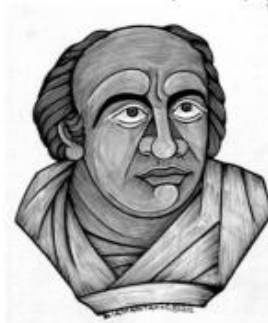
ΕΚΑΤΑΙΟΣ Ο ΜΙΛΗΣΙΟΣ

Κάποιοι θέλησαν να γράψουν για τα περασμένα, για να μην ξεχαστούν.