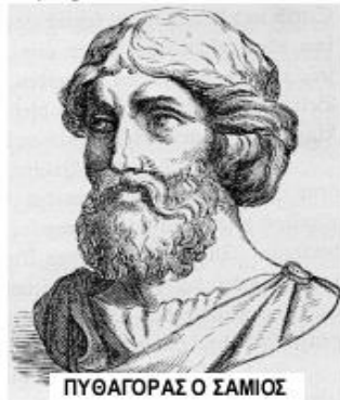
ΠΥΘΑΓΟΡΑΣ Ο ΣΑΜΙΟΣ